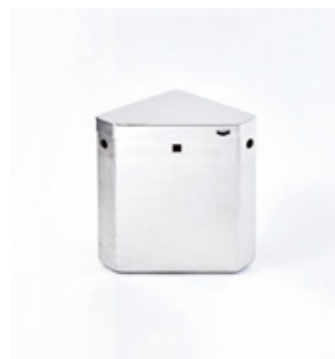
コーナー型タンク [M-1001]